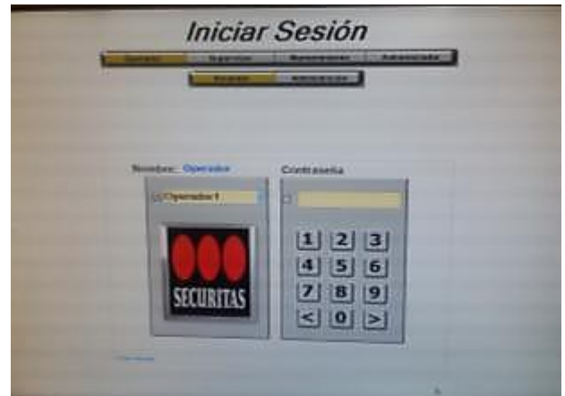
Creación de cuentas de operador