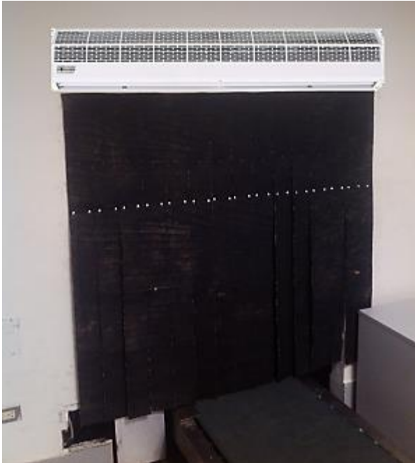
Lado counters Cias.