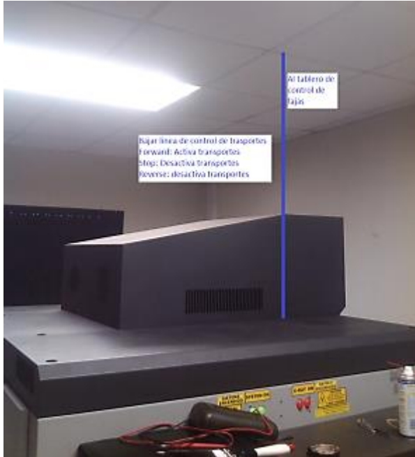
Salida de línea de control de la unidad RX