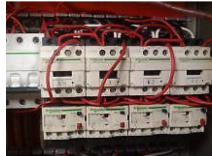
Tablero de control de fajas