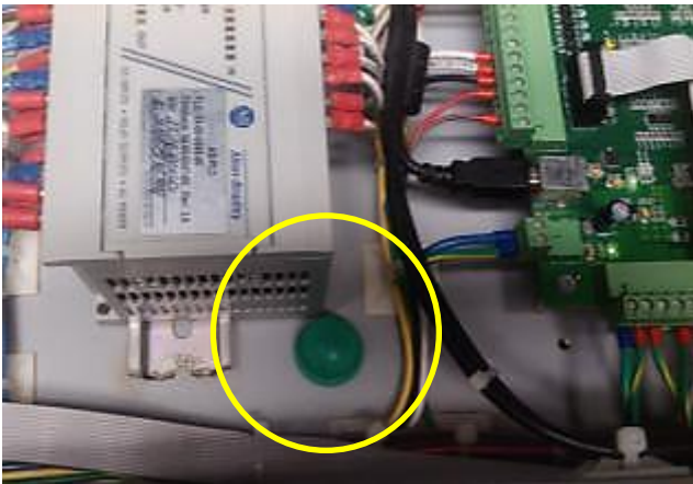
Secante iónico instalado en el sector de la electrónica