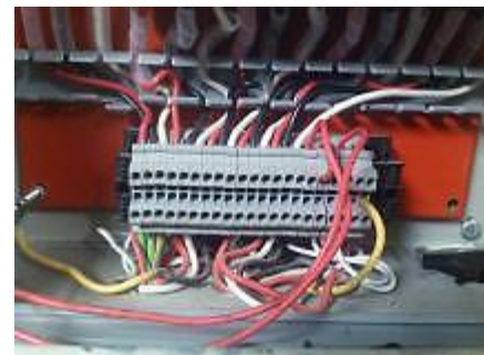
Punto de interconexión

Previo a la interconexión, es necesario reparar el tablero, el cual fue manipulado, al parecer generando By-Pass del sistema automático de protección (Imagen de configuración original, con contactores forzados)