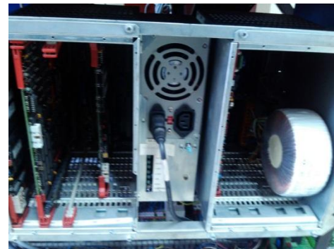
Mantenimiento Equipo Inspección Rayos X