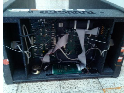
Mantenimiento y Ajustes Pórtico Detector de Metales